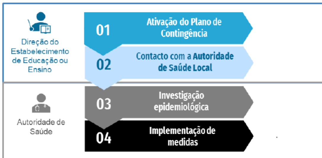
Figura 2. Fluxograma de atuação perante um caso confirmado de COVID-19 em contexto escolar

Se o caso confirmado tiver sido identificado fora do estabelecimento de educação ou ensino, devem ser seguidos os seguintes passos: