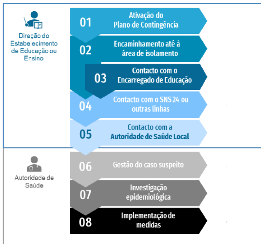
Figura 1. Fluxograma de atuação perante um caso suspeito de COVID-19 em contexto escolar

Perante a identificação de um caso suspeito, devem ser tomados os seguintes passos: