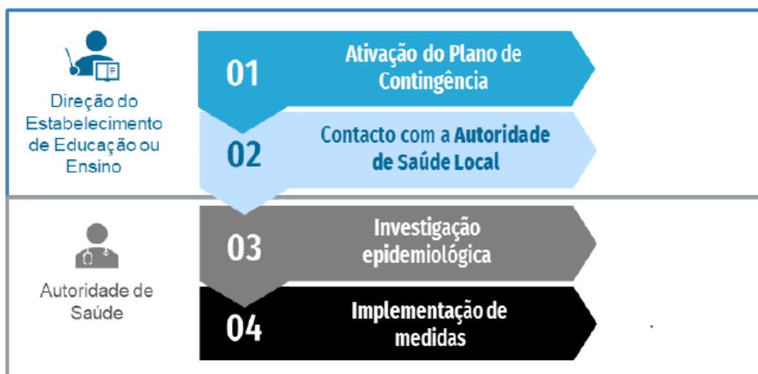
Figura 2. Fluxograma de atuação perante um caso confirmado de COVID-19 em contexto escolar

Se o caso confirmado tiver sido identificado fora do estabelecimento de educação ou ensino, devem ser seguidos os seguintes passos: